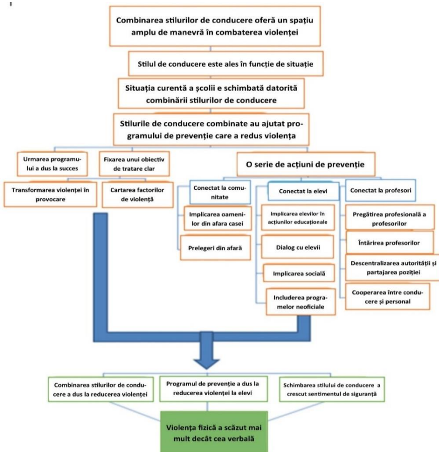
Fig.1. Model managerial de intervenție privind prevenirea și reducerea violenței în școală

În acest context, a fost elaborat un Model managerial de prevenire și reducere a violenței în școală , axat pe principiile și prevederile conceptuale ale cercetării reflectate în Fig. 1.